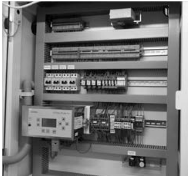
Bild 2: Niederspannungsnische eines Streckenabgangs vor dem Umbau.

Nachdem diese vorbereitenden Leistungen abgeschlossen waren, wurden die Leittechnik im ersten Gleichrichter und den ersten vier Streckenabgangsfeldern erneuert. Es wurden die Schutz- und Steuergeräte demontiert und durch das aktuelle Schutz- und Steuergerät von Rail Power Systems GmbH des Typs TracFeed DCP 2 ersetzt. Die Ansteuerung des Leistungsschalters sowie die Kabelüberwachung wurden an das neue Schutz- und Steuergerät angepasst. Die Bilder 2 und 3 zeigen die