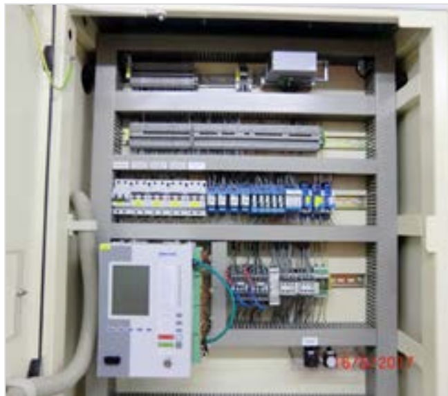
Bild 3: Niederspannungsnische eines Streckenabgangs nach dem Umbau.

Niederspannungsnische eines Streckenabgangsfeldes vor und nach dem Umbau.